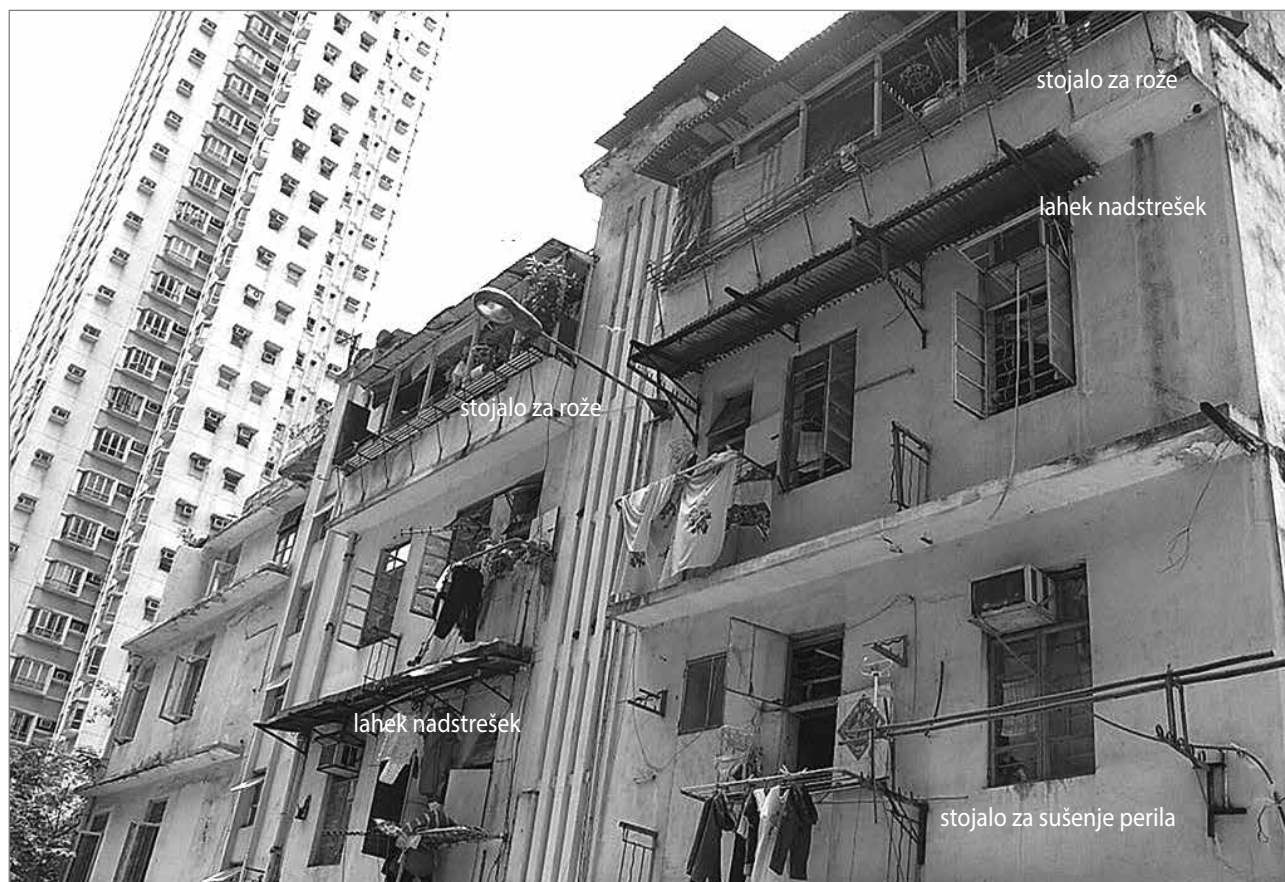
Slika 1: Lahki nadstreški ter stojala za rože in sušenje perila