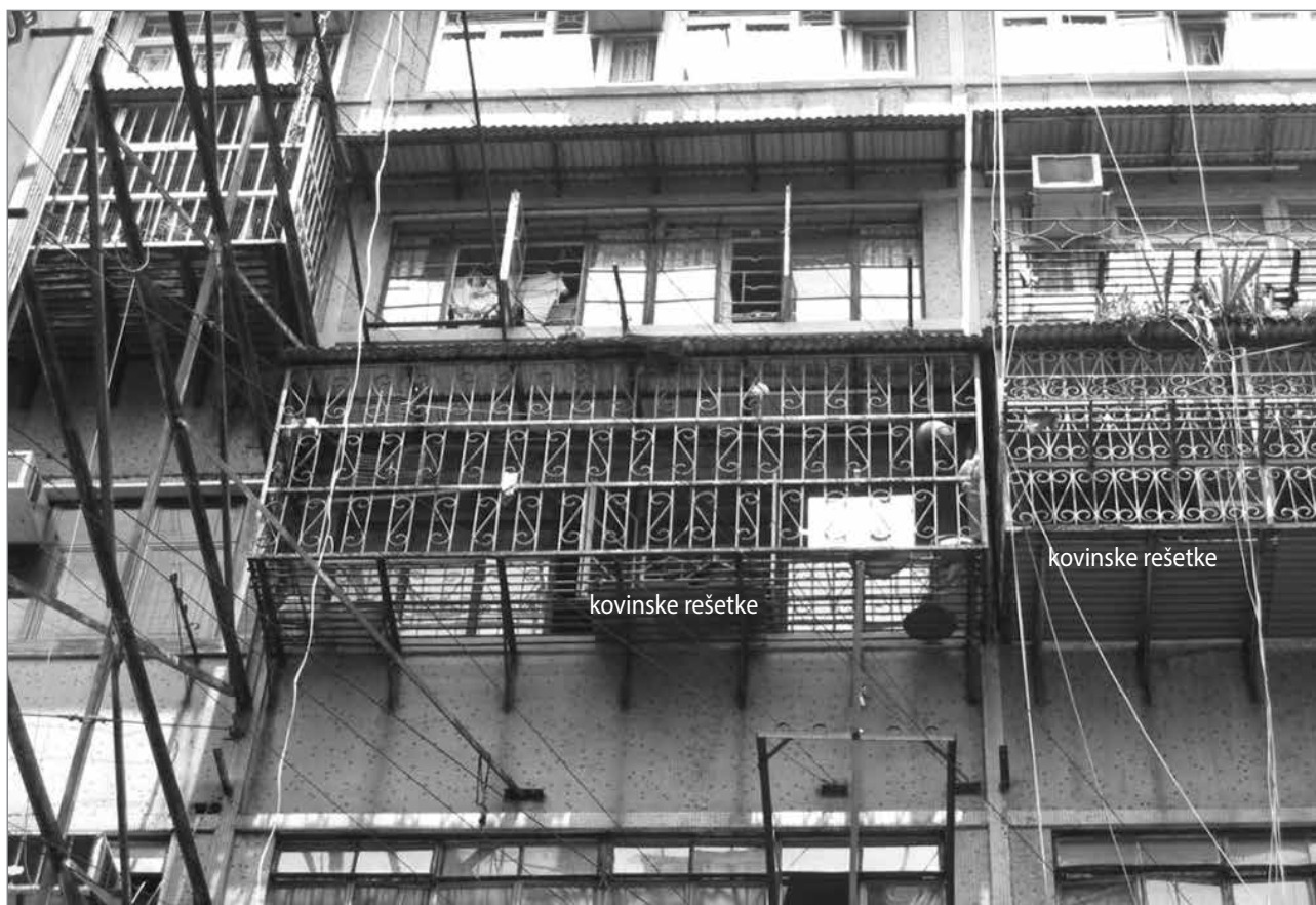
Slika 3: Kovinske rešetke

bi pri preučevanju nedovoljenih dodatnih elementov upoštevali vpliv tržnih zavarovanj.